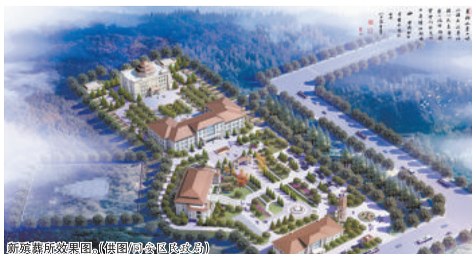
新殡葬所效果图。