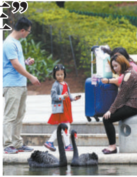
昨日,游客观赏厦门大黑天鹅。

热的感觉挥之不去。昨晚,旺盛的水汽凝成了无边的大雾,各地能见度严重下降,市气象台于20时40分左右发布了大雾黄色预警信号,提醒市民注意出行安全。 今天,偏南暖湿气流将重新把厦门裹住,气温开始快速攀升。未来三天,我市以多云天气为主,市区最高气温将攀至28°C至29°C。空气湿度仍然很高,维持在65%至95%之间,这也导致晨昏依旧雾气深重,能见度较差。 眼下强降雨带依然在长江中下游一带徘徊,明后天会渐渐向南挪动。8日前后,降雨带将“蹭”到厦门,我市局部地区会出现阵雨或雷阵雨天气,不过雨量不会很大。10日至11日,我市将迎来较为显著的降雨。